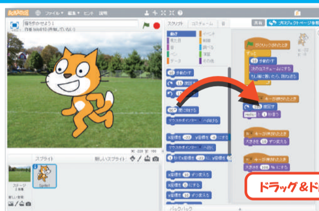
マウス操作と簡単な入力で作成できます！

創造力を働かせ、アイデアしだいで面白いゲームやアニメーションを作ることができます！ 自分のアイデアが形になる楽しさを体験していただけます！